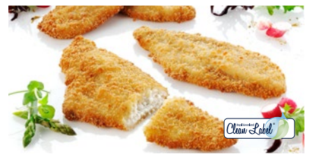
Flunderfilets , paniert Verzehrfertig (54 % Fisch) Gewicht: 70 - 100 g, 5.000 g Art.-Nr. 152 709 600