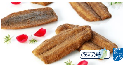
Heringsfilets in Roggenpanade Verzehrfertig (80 % Fisch) Gewicht: 80 - 125 g, 5.000 g Art.-Nr. 153 639 010