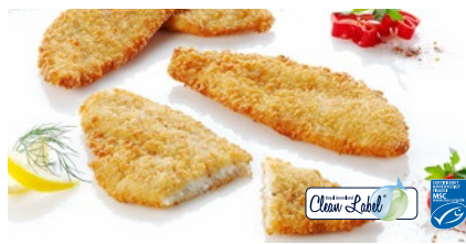
Schollenfilets , paniert Verzehrfertig (60 % Fisch) Gewicht: 70 - 100 g, 5.000 g Art.-Nr. 152 709 500