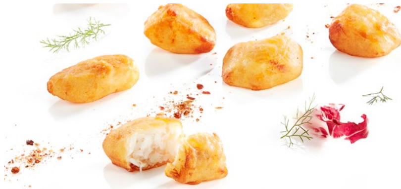
Alaska Seelachs Nuggets in Tempura-Teig Verzehrfertig (80 % Fisch) Gewicht: 16 - 26 g, 2 x 2.500 g Art.-Nr. 154 054 102