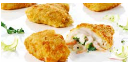
Schollenfilet paniert, gefüllt mit Broccoli und Garnelen

Art.-Nr. 161798000 160-180 g, Abpackung 5 kg