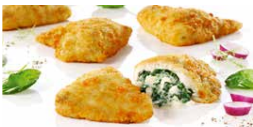
Schollenfilet paniert, gefüllt mit Spinat und Feta

Art.-Nr. 161784000 120-160 g, Abpackung 5 kg