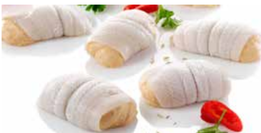
Schollenfilet mit Lachsmousse