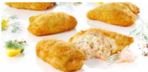
Schollenfilet paniert, gefüllt mit Garnelen

Diese Produkte sind für Schollenliebhaber ein Muss!