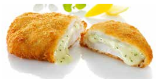
Schollenfilet paniert, gefüllt mit Sauce Béarnaise

Art.-Nr. 161797100 120-160 g, Abpackung 5 kg