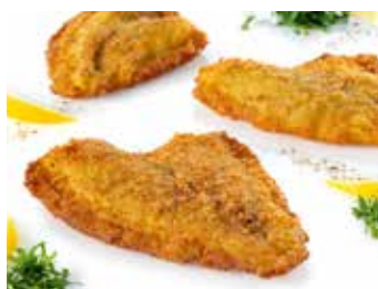
Schollenfilet paniert mit Zitrone und Petersilie

Art.-Nr. 152761000 100-130 g, Abpackung 5 kg