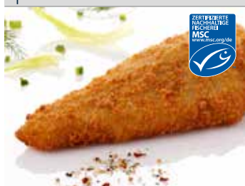
Nordsee Schollenfilet paniert

Art.-Nr. 152702045 45-70 g, Abpackung 5 kg