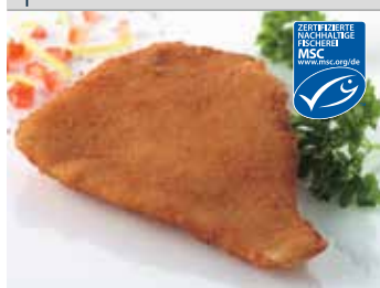
Nordsee Schollenfilet paniert

Art.-Nr. 152504500 140-160 g, Abpackung 5 kg