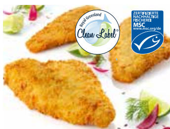
Nordsee Schollenfilet paniert

Nordsee Schollenfilet paniert Paniert mit einer knusprigen Panade. Vorgebraten, Fischanteil 60%, Fanggebiet Nordostatlantik