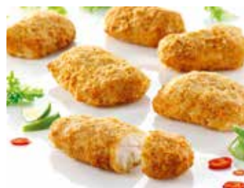
Kabeljau Loins in Backteig