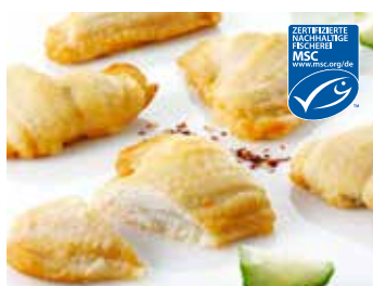
Schollenfilet, 8% leichte Mehlierung

Schollenfilet, 8% leichte Mehlierung Verfeinert mit einer leichten Mehlierung. Vorgebraten, Fischanteil 92%, Fanggebiet Nordostatlantik, Nordsee