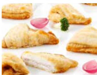
Flunderfilet, 8% leichte Mehlierung

Art.-Nr. 152200000 100-120 g, Abpackung 5 kg