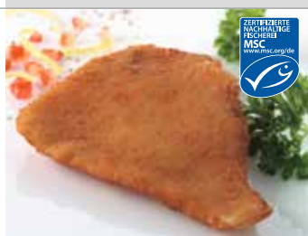
Nordsee Schollenfilet paniert

Art.-Nr. 152704000 100-130 g, Abpackung 5 kg