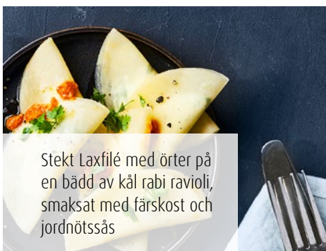
Stekt Laxfilé med örter på en bädd av kål rabi ravioli, smaksat med färskost och jordnötssås

Alla Royal Greenlands naturliga fiskprodukter säljs dessutom som netto-vikt. På så sätt kan du vara säker på att du inte betalar för vattnet!