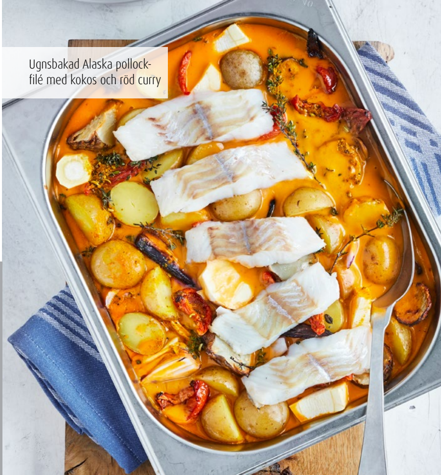
Ugnsbakad Alaska pollock-filé med kokos och röd curry

BY APPOINTMENT TO THE ROYAL DANISH COURT