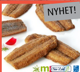
Strömming-/Sillfilé färdigstekt rågmjölspanerad (80% fisk) 80 - 125g, 5 kg Art.nr. 153 639 010