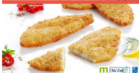
Rödspättafilé, panerad färdigstekt (60% fisk) 70 - 100g, 5 kg Art.nr. 152 709 500