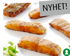
NYHET! Varmrökt liten grönländsk hällefundra, portionsbit ca 100g Enh/krt. 10 portioner x 10 Art.nr. 121 760 111