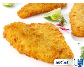
Rödspättafilé, dubbel, panerad, förstekt 60% fisk 130 - 160g, 5 kg Art.nr. 152 255 000