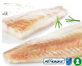
Sejfilé 100 - 300g , 5 kg Art.nr. 133 100 300 125 - 250g , 5 kg Art.nr. 133 125 250