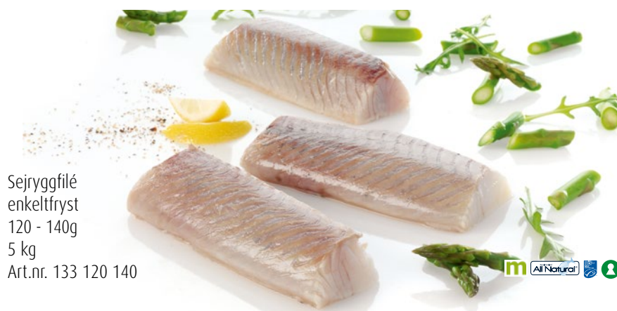
Sejryggfilé enkeltfryst 120 - 140g 5 kg Art.nr. 133 120 140